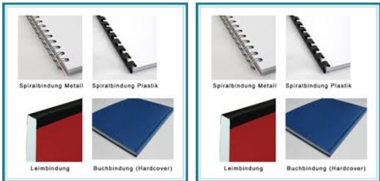
Abbildung 2: Beispiele nebeneinander stehende Bilder [2]

Ein Beispiel für Bilder, die nebeneinander angezeigt werden sollen, sieht man in Abb. 2. Quellenangabe nicht vergessen!